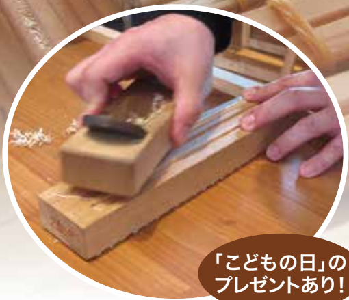
「こどもの日」のプレゼントあり!